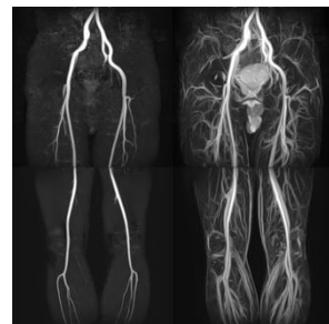
下肢動脈 下肢静脈